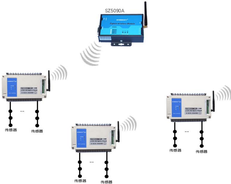
多套组网无线系统